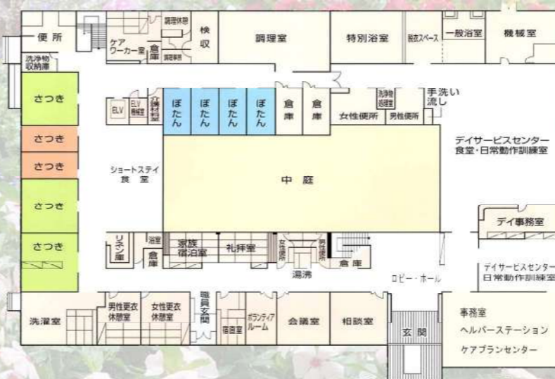
1F ショートステイ デイサービスセンター